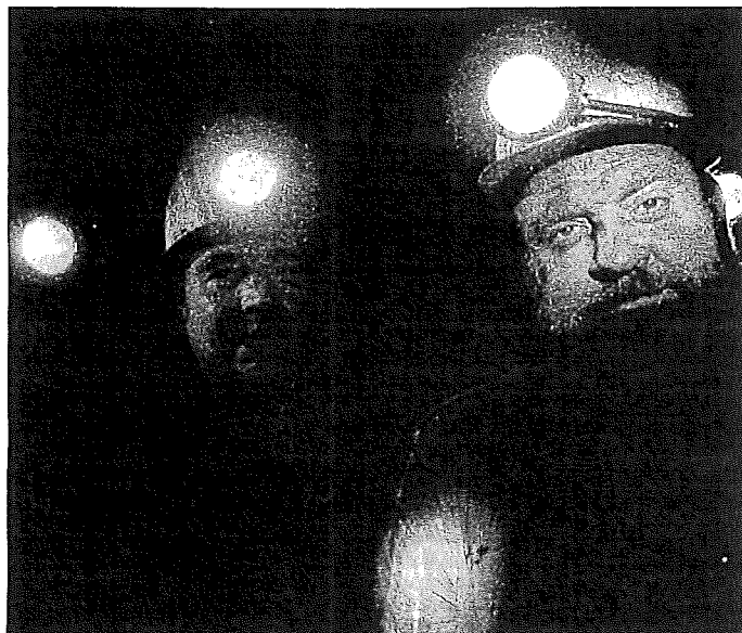
Un énorme travail photographique « revisité » par le Jazz contemporain.

Montrez le livre à Franck Tortiller. Prenez une ville au passé minier, en l'occurrence Montceau. Sur grand écran, faites projeter des photographies sur les murs, lors de l'inauguration des ateliers de jour en centre culturel.